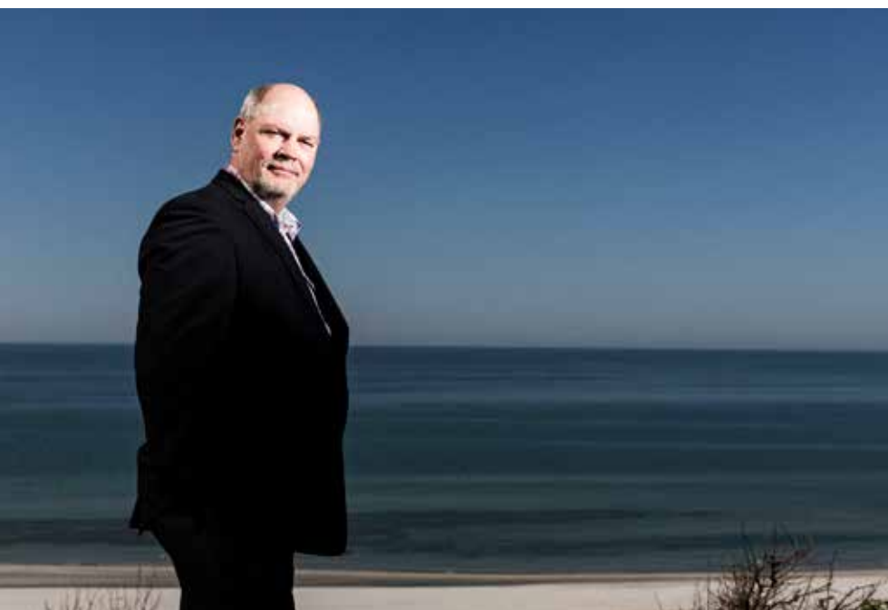
Carsten Hansen, minister for by, bolig og landdistrikter.